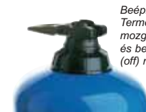
Beépített By-pass: Termék mozgásbahozásának (on) és beszívás megállításának (off) rendszere

A Dosatron készülékekhez ajánlott opciók lehetőségek segítenek Önnek az adott feltételekhez történő tökéletes alkalmazkodáshoz. Az esetleges opciók kiválasztásában szakembereink állnak szíves rendelkezésükre